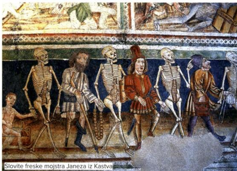
Slovite freske mojstra Janeza iz Kastva