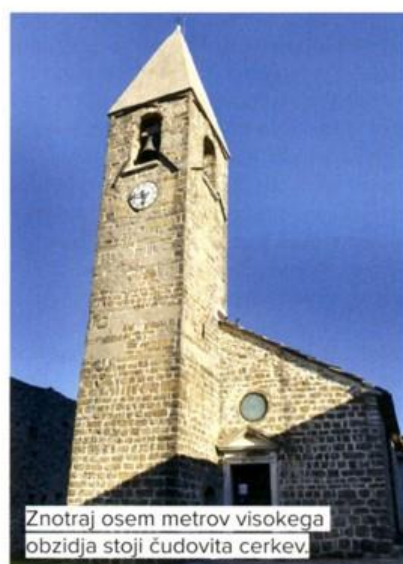
Znotraj osem metrov visokega obzidja stoji čudovita cerkev

Za obdobje od začetka 15. do prve polovice 17. stoletja so bili značilni pogosti roparski vpadi Uskokov, zato je bil