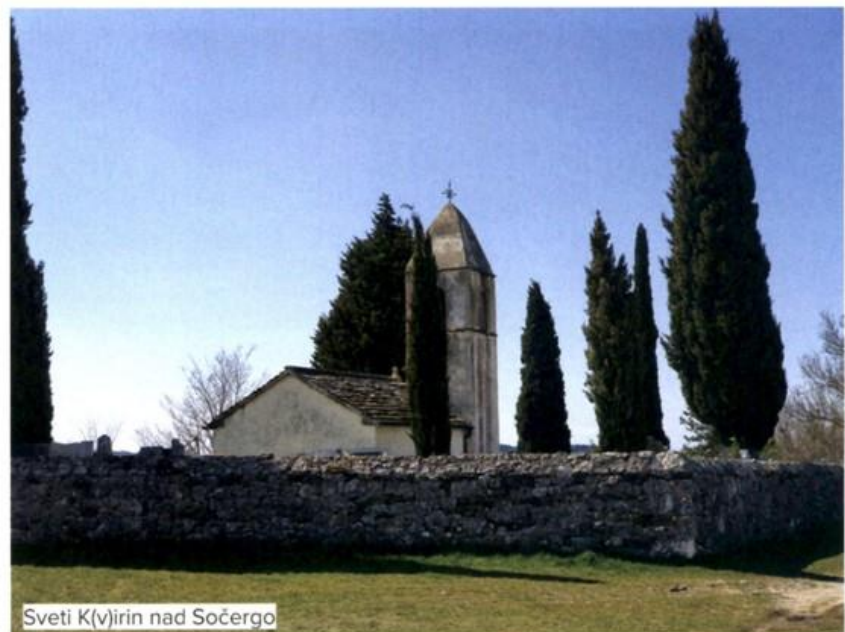
Sveti K(v)irin nad Sočergo

Pot nadaljujemo proti meji. Najprej se peljemo skozi Kubed, ki smo ga lahko opazovali tudi s Črnega kala. Vas stoji na skrajnem severovzhodu Šavrinskega gričevja, na robu podolja, kjer se stikata flišni in kraški svet. Hiše so v nizih razporejene pod kraško vzpetino Grad, na kateri je ohranjen del nekdanje srednjeveške utrdbe s peterokotnim obrambnim stolpom ob vhodu, ene od tistih, ki jih je dal zgraditi istrski mejni grof Ulrich Weimarski. Z nje so lahko nadzorovali trgovske poti med celino in notranjostjo Istre ter je v času napadov