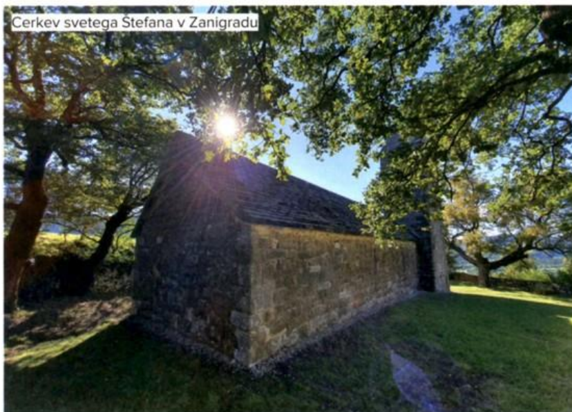
Cerkev svetega Štefana v Zanigradu