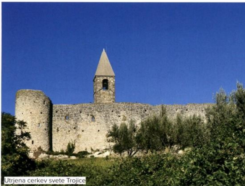
Utrjena cerkev svete Trojice