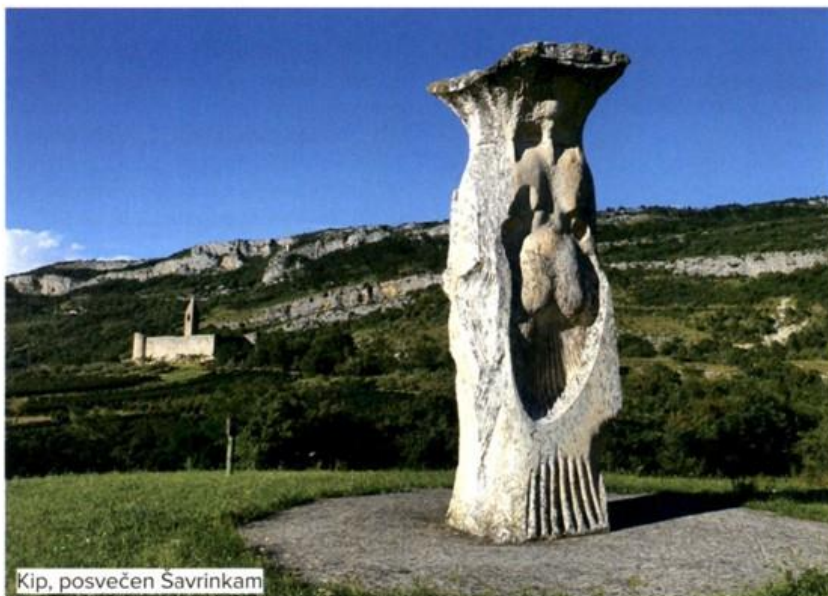
Kip, posvečen Šavrinkam

Le streljaj naprej je vasica Hrastovlje. Morda bi vasico zaradi njene lege skorajda v zatrepu doline zlahka spregledali, če ne bi na vzpetini nad vasjo stala znamenita cerkev Svete Trojice. Na tem mestu je že pred tisočletji stalo gradišče, utrdbo, ki jo je dala zgraditi družina Neuhaus, pa so zgradili prav iz materiala, ki je bil del ruševin. Obzidje, obdajajoče cerkev v obliki nepravilnega pravokotnika (približni tloris 32 x 16 metrov), je grajeno iz lomljenega apnenca in je še zdaj visoko okoli osem metrov. V diagonali sta na vogalih okrogla obrambna stolpa; eden je na severovzhodni strani, drug pa je varoval edini vhod z vaše strani. Izza obzidja se ponosno pne v nebo skoraj devetnajst metrov visoki zvonik. Obrambnemu sestavu je nekoč pripadal še pomol nad vhodnimi vrati, s katerega so v temačni preteklosti nad