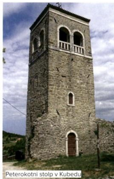
Peterokotni stolp v Kubedu

vdirajočega sovražnika spuščali kamenje, zlivali vrelo vodo, olje, smolo in podobna sredstva dobrodošlice.