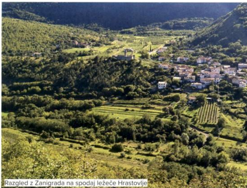
Razgled z Zanigrada na spodaj ležeče Hrastovelje