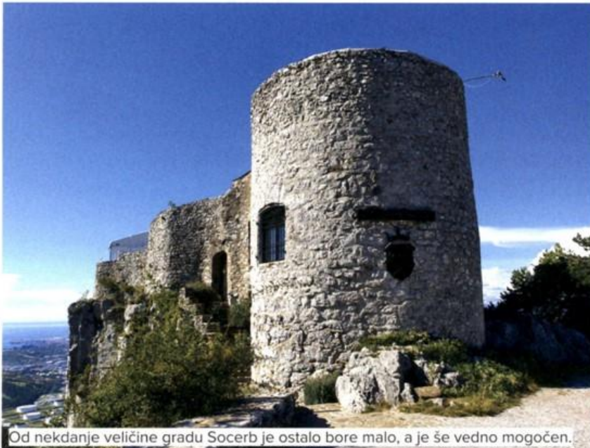
Od nekdanje veličine gradu Socerb je ostalo bore malo, a je še vedno mogočen.