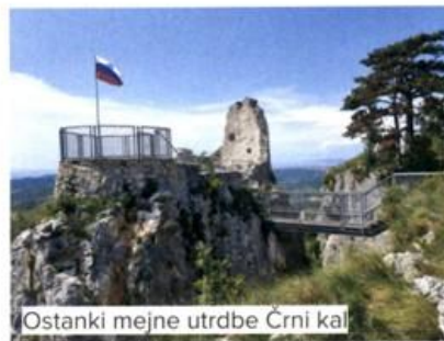
Ostanki mejne utrdbe Črni kal

grajskem dvorišču pa se nahaja manjša kraška jama.