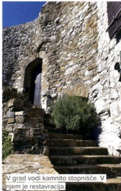
V grad vodi kamnito stopnišče. V njem je restavracija.

Z akaj bi za konec tedna hiteli na Obalo? Slovenska Istra niso samo obalna mesta, mnogo očarljivejše je zaledje, kjer se pod Kraškim robom skrivajo kotički, ki jemljejo sapo.