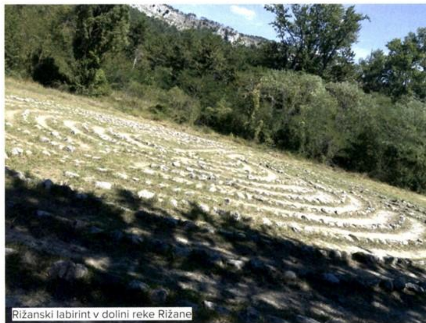
Rižanski labirint v dolini reke Rižane