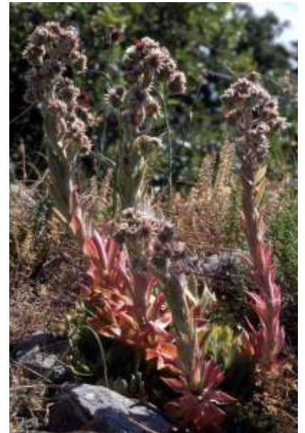
Sempervivum tectorum

Tako so tudi v Pregari, kjer so vse do leta 1960 ženske rodile doma, pred prvo vojno ob pomoči babe Luce in še okoli 1950, ob pomoči vaščanke Marije